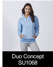
Duo Concept SU1068